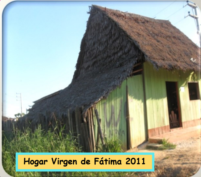
Hogar Virgen de Fátima 2011

Si quieres colaborar con nuestro Hogar, puedes hacerlo en: