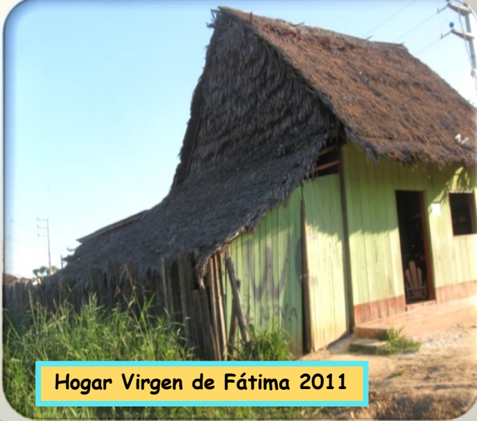
Hogar Virgen de Fátima 2011

Si quieres colaborar con nuestro Hogar, puedes hacerlo en: