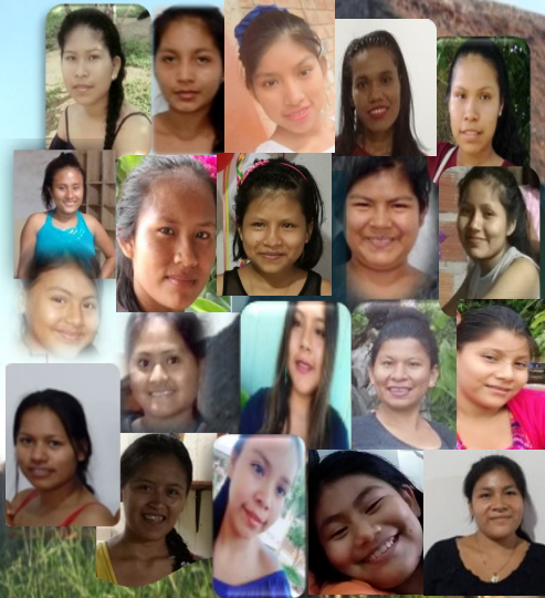
HOGAR VIRGEN DE FATIMA

Si quieres colaborar con nuestro Hogar, puedes hacerlo en: