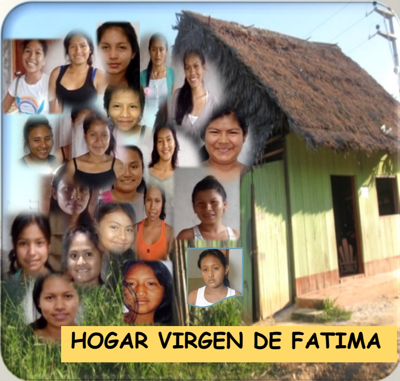
HOGAR VIRGEN DE FATIMA

Si quieres colaborar con nuestro Hogar, puedes hacerlo en: