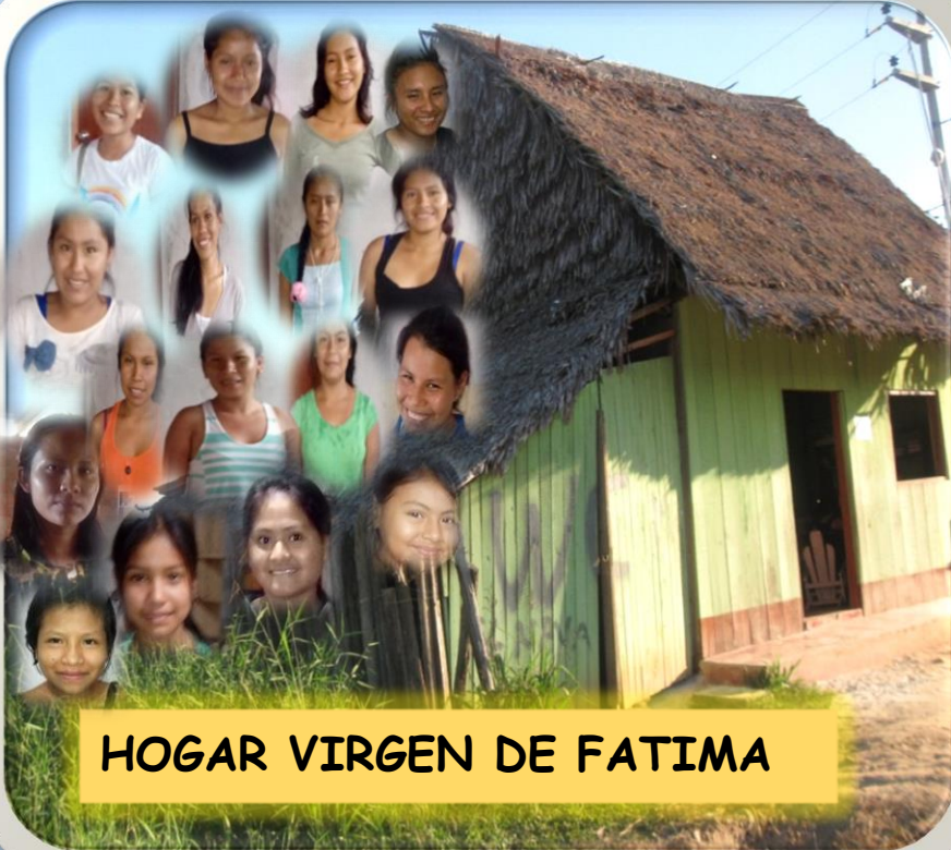
HOGAR VIRGEN DE FATIMA

Si quieres colaborar con nuestro Hogar, puedes hacerlo en: