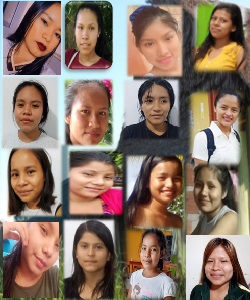
HOGAR VIRGEN DE FATIMA