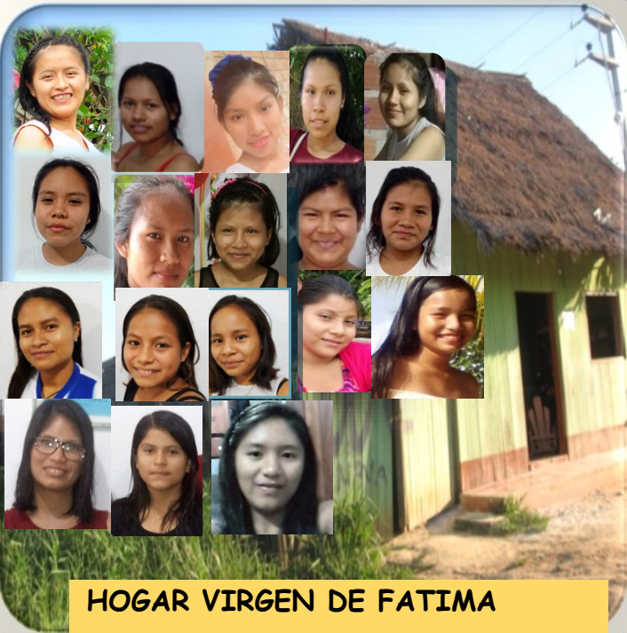
HOGAR VIRGEN DE FATIMA

Si quieres colaborar con nuestro Hogar, puedes hacerlo en: