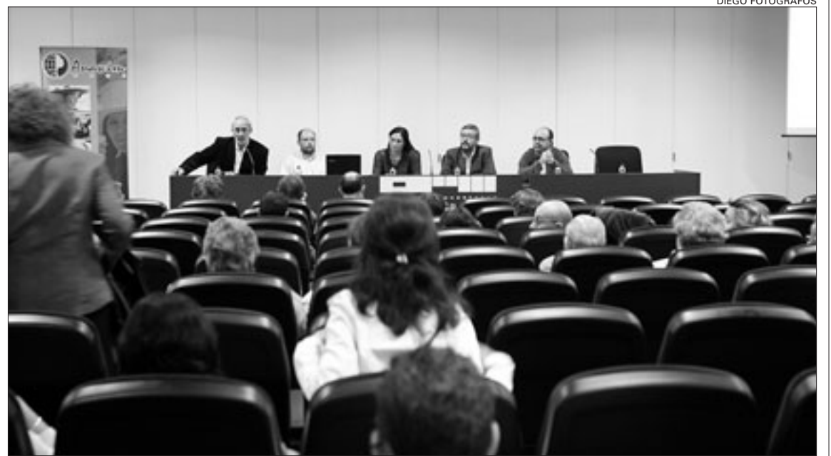
La ONG presentó su balance de actividades en un acto celebrado en el Centro de Congresos